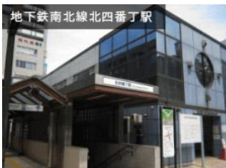
北四番丁まで徒歩10分(800m)