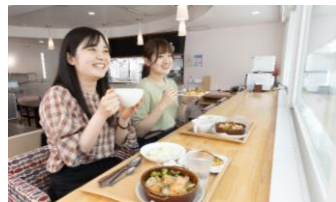
健康的でバランスの取れたメニューです。 旬の食材もいっぱい♪

完全個室。トイレ・バス、キッチンあり。 生活に必要な家具家電がそろった快適空間。