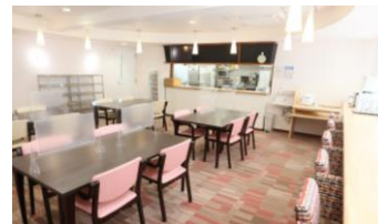
落ち着いたかわいいダイニングで、ゆつくり と美味しいお食事を。