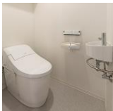
タンクレストイレ