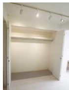
大容量クローゼット